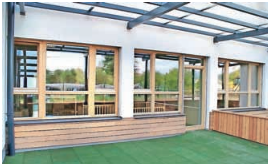
Nova okna v vrtcu v Lescah