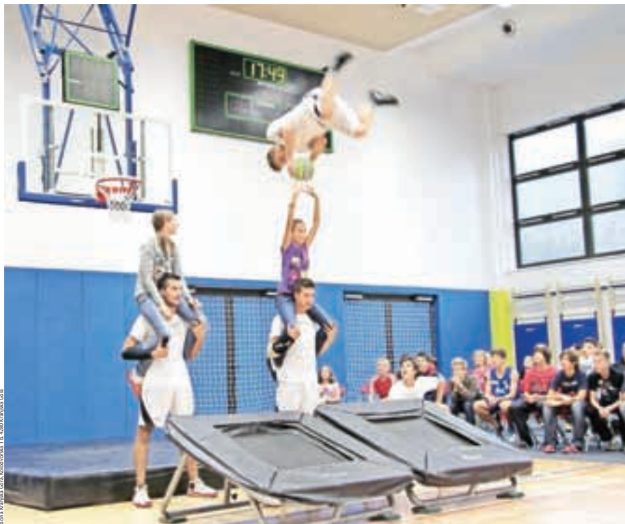
Največja investicija zadnjih nekaj let je popolnoma obnovljena Osnovna šola Josipa Vandota Kranjska Gora.

Občina je ves čas skrbela tudi za razvoj in promocijo turizma, prav tako gradi in vzdržuje turistično in športno infrastrukturo. Zgrajeni in obnovljeni so novi prostori turistično informacijskega centra, nadaljuje se sofinanciranje gradnje športnega parka v Kranjski Gori, igrišča v Ratečah, obnove sistema za zasneževanje v Podkorenu in plezalne stene v mojstranški osnovni šoli. Občina se aktivno vključuje v projekt izgradnje nordijskega centra Planica.