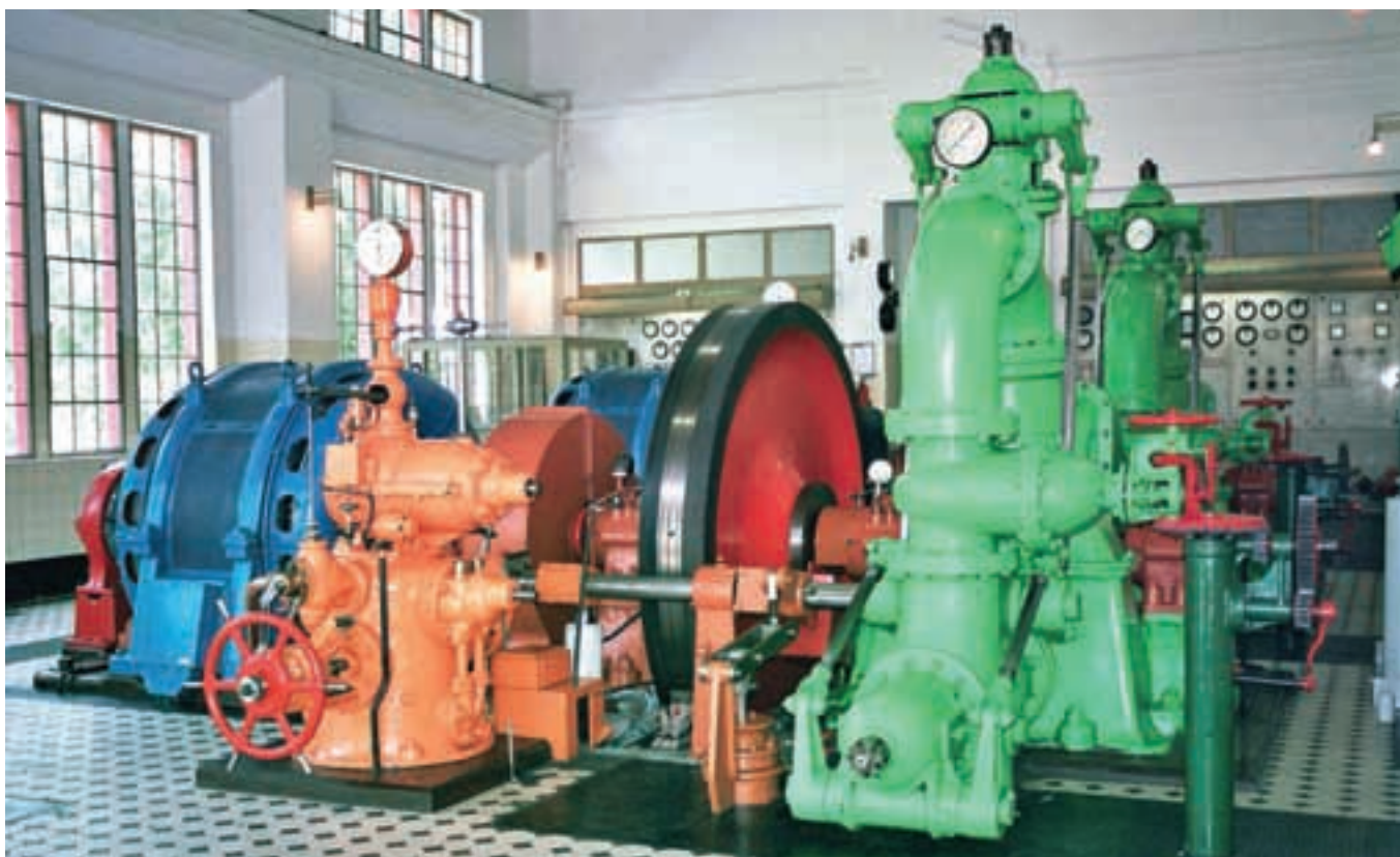
Električna energija iz HE Završnica

Elektrificirani otočki, ki so se množili v naslednjih letih, so nastajali predvsem zaradi potreb takratnih industrialcev, niso še začetek splošne elektrifikacije dežele, saj za to ni bilo ustreznega programa, tudi prevladujoč enosmerni sistem za splošno elektrifikacijo ni bil primeren. Le počasi se je večalo število mešanih elektrarn, ki so poleg energije za industrijske obrate lastnikov