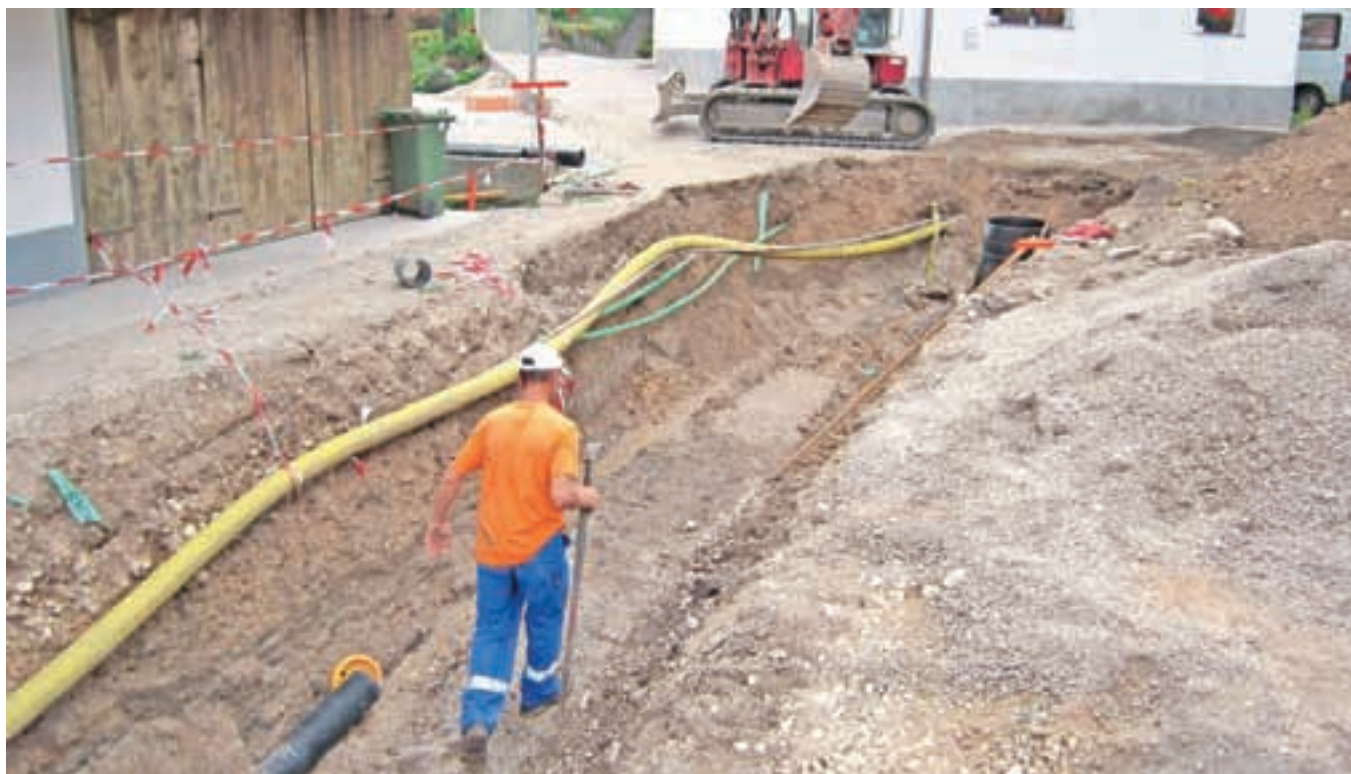
V Krnici so v celoti obnovili infrastrukturo.