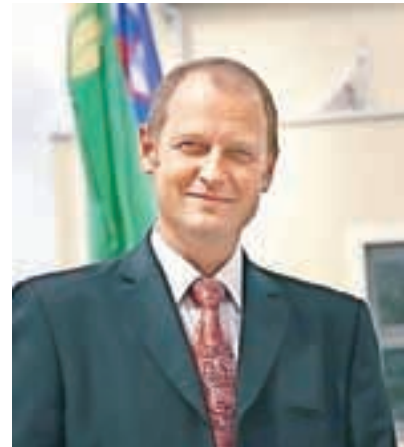
Župan Leopold Pogačar

trim stezo, urejenimi kurišči in igriščem za odbojko na mivki ter gostinskim objektom (tega je uredil zasebnik). V sklopu celovitega urejanja doline Završnice je bilo v tem mandatu urejeno tudi parkirišče in cesta z ostalo komunalno infrastrukturo. »Obisk Završnice kaže, da je to odlična turistična točka, ki jo obiskujejo ne le planinci, temveč tudi številne družine z otroki, česar sem še posebej vesel,« poudarja župan. Občina je skrbela tudi za spodbujanje razvoja podjetništva, tako je zaživela Poslovna cona Žirovnica, podjetnike na območju poslovne cone pa so delno oprostili plačila komunalnega prispevka za priključitev na obstoječo komunalno infrastrukturo. S tem so naredili konkreten korak za pomoč pri oživljanju gospodarstva v občini. Obenem so v proračunu namenili sredstva za sofinanciranje obrestne mere za domače podjetnike in obrtnike. Občina začenja tudi gradnjo neprofitnih stanovanj na Selu, zagotavlja dovolj sredstev in pogoje za delo društev na področju športa, kulture in sociale. Župan posebej izpostavlja dobro sodelovanje z društvi in njihovo vlogo pri dogajanju v občini, omenja pa tudi vzorno skrb za starejše prek Društva upokojencev Žirovnica v projektu Starejši za starejše.