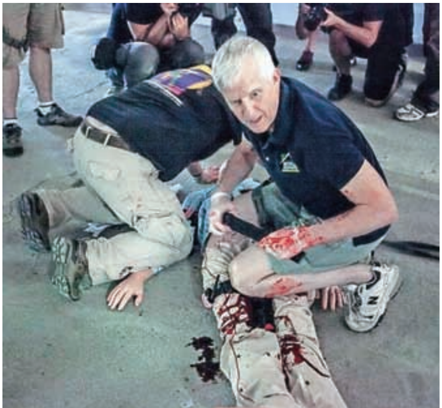
Trije inštruktorji so vaje demonstrirali izjemno natančno.

Na tečaj trikrat letno zaradi visoke intenzivnosti učenja sprejmejo le okoli dvajset fotoreporterjev in novinarjev z vsega sveta, ki pa že morajo imeti potrebne reference in izkušnje s konfliktnih območij. Matic je v zadnjih štirih letih že večkrat obiskal Gazo, množične nasilne proteste v Kairu in libanonsko-sirska mejo. Znanje, ki jim ga je na omenjenem tečaju brezplačno omogočila pridobiti neprofitna organizacija RISC (Reporters Instructed In Saving Colleagues – reporterji, izobraženi za reševanje kolegov), je zajel s polno žlico.