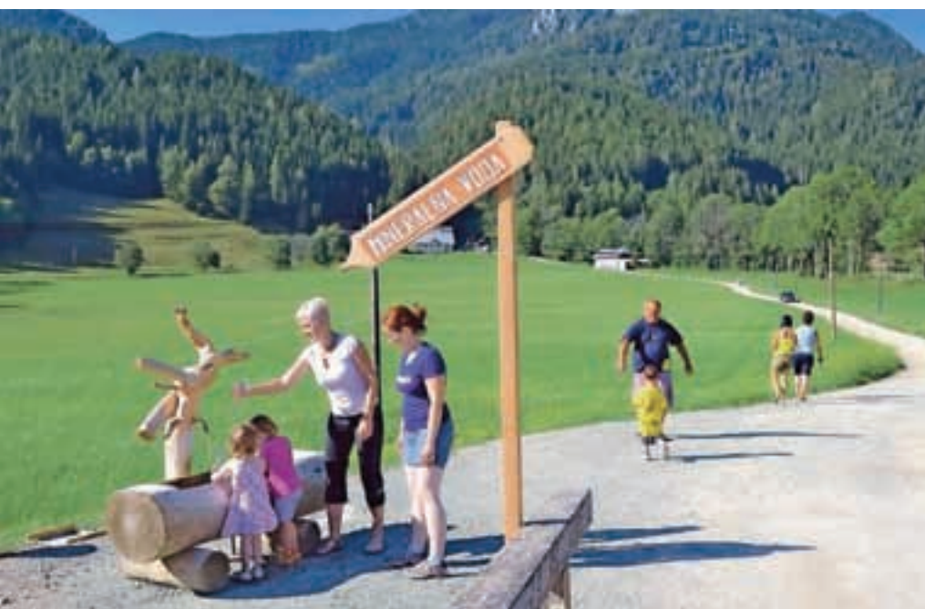
Točilno mesto jezerske mineralne vode