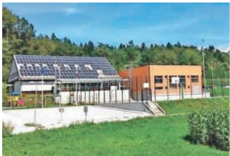
Prihodnost so naši otroci. Obnovljena in dozidana šola v Besnici.