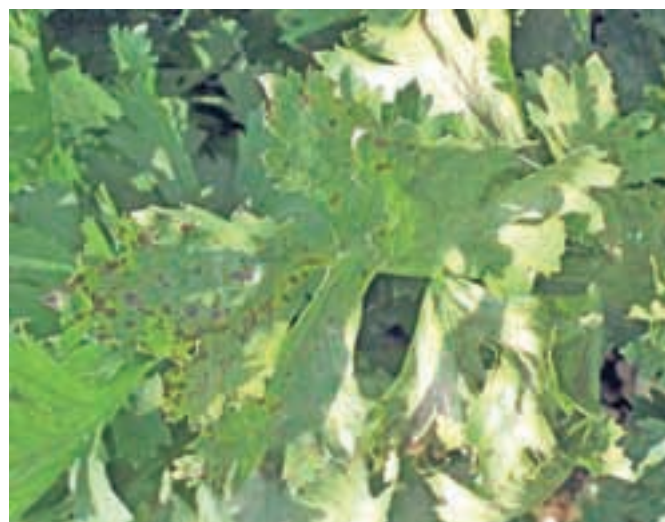
Listna pegavost zelene