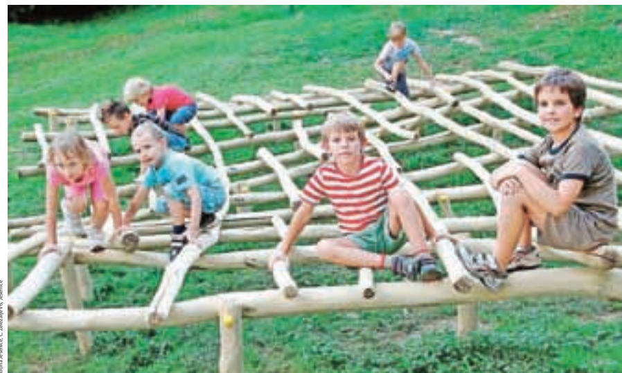
Župan izpolnjuje obljubo, da vsako leto uredijo vsaj eno otroško igrišče v občini.

»Vsa leta smo se trudili obnoviti čim več cest, omenil bi samo nekaj največjih: obnovo Ceste Cirila Tavčarja, Hermanovega mostu, mostu čez Savo v Podmežakli, uredili smo parkirišče na mestu nekdanjega minigolfa, odsek ceste in parkirišča za avtobuse v Planini pod Golico, prenovili cesto v Javorniški Rovt,« je povedal župan. Obnovili so tudi več šol, večji investiciji pa sta bili ureditev mansarde v Osnovni šoli Koroška Bela in energetska sanacija Osnovne šole Toneta Čufarja ter prenove stavb vrt-