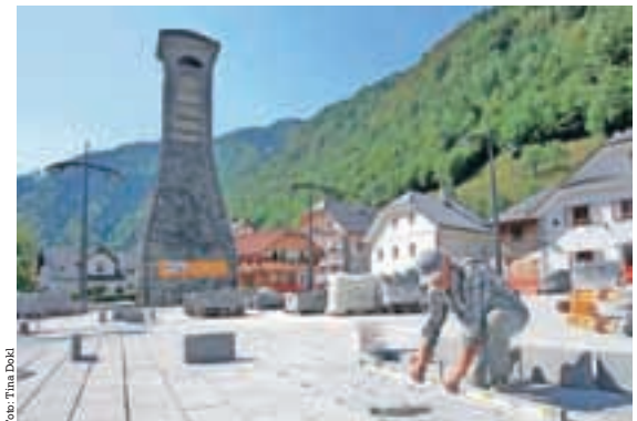
Lepše urejeni trgi in mestne ulice