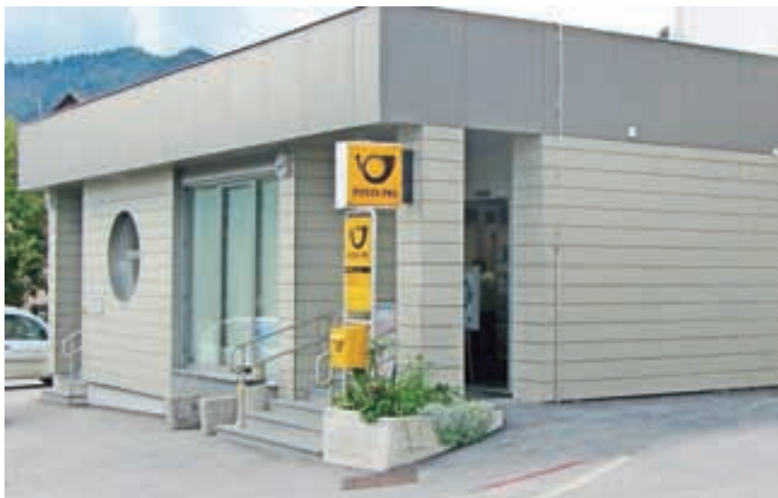
Nova stavba Občine in Pošte

Občina zagotavlja sredstva tudi za opremo v okviru programa zaščite in reševanja. Lani je Prostovoljno gasilsko društvo Gorje prevzelo novo kombinirano vozilo za prevoz moštva in opreme GVC 16/25. Občina jim je za nakup vozila zagotovila slabih 194 tisoč evrov. Sofinancirali so še nakup vozila GVM – 1, za katerega je Občina prispevala dobrih 27 tisoč evrov.