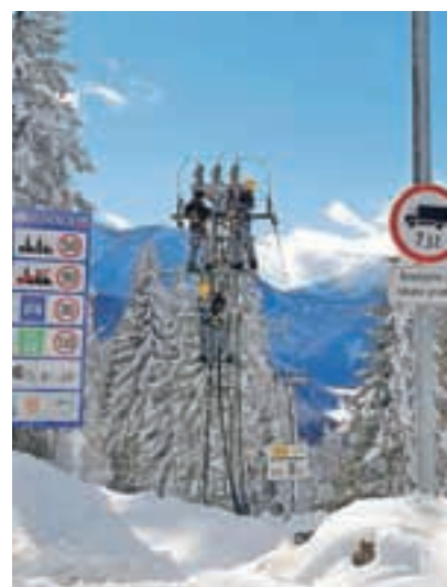
Zaradi posledic žledoloma nam je z neprecenljivo pomočjo podjetij Elektro Gorenjska in Kelag ter Občine Železna Kapla in Generalnega konzulata RS Celovec uspelo zgraditi električno povezavo med Jezerskim in sosednjo Avstrijo.