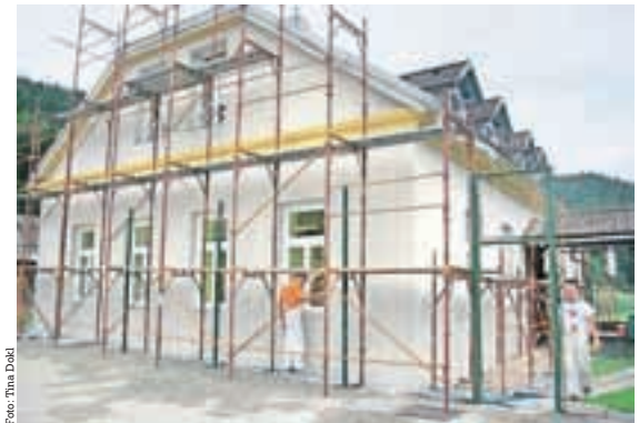
Šolarje so dočakale energetske obnovljene šole.