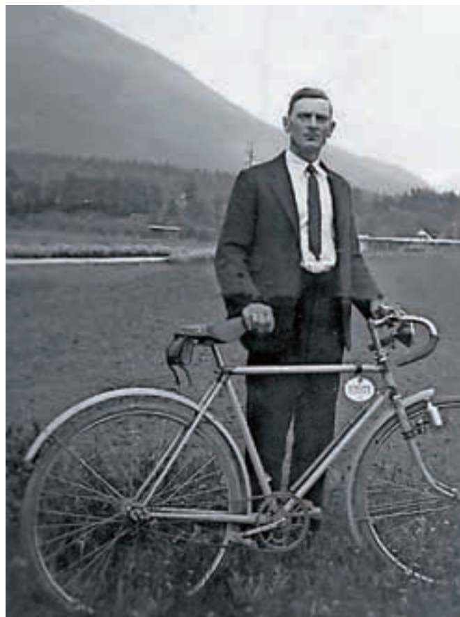
S kolesom pred Olševkom

Doma se je življenje spremenilo. Prejšnje blagostanje se je spremenilo v splošno pomanjkanje. Primanjkovalo je moke. Špicerije in mesnice so se zapirale. Po vaseh so z zvonikov snemali zvonove za topove. V mestu so bile odpovedane vse prireditve. Ljudje so se srečevali le pri mašah in pogrebih. Njihovi obrazi so bili resni, lica upadla. Kar nekaj tistih fantov, s katerimi sem bil skupaj na »štelengi«, je padlo v boju za cesarstvo in njihove družine so se zagrnile v žalost. Nekaj se jih je vrnilo, vendar so bili invalidi. Spoznal sem, kakšno srečo