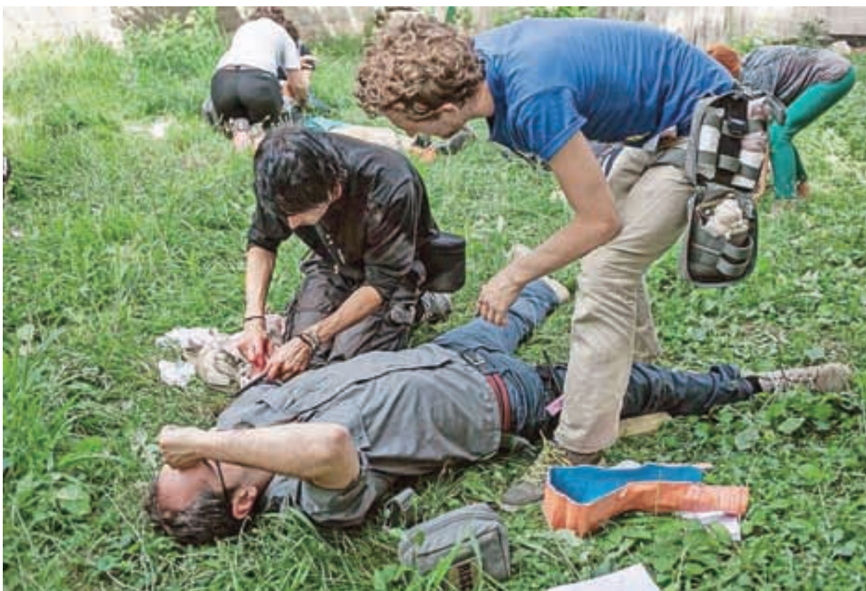
Ena izmed mnogih vaj zaustavljanja krvavitev, kombiniranih z različnimi poškodbami

Delo fotoreporterjev in novinarjev zna biti tudi zelo nevarno, sploh za tiste, ki delajo na konfliktnih območjih. Med takšne občasno sodi tudi naš sodelavec Matic Zorman, ki se je zato nedavno na Kosovu udeležil posebnega tečaja prve pomoči.