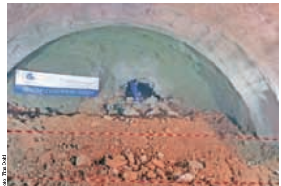
Letošnji preboj predora na trasi Poljsanske obvoznice, največjega projekta na državnih cestah.