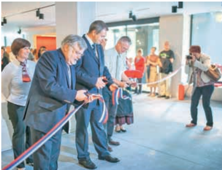
Regijsko povezovanje dobiva vse večji pomen. Regionalna destinacijska organizacija Gorenjske in Infocenter Triglavsko roža Bled sta dobra popotnica drugim projektom. Tudi blejski obvozniki sta regionalna projekta, saj krepijo gospodarsko konkurenčnost blejsko-bohinjsko-gorjanskega kota, kjer zlasti prevladujeta turizem in gozdarsko-lesnopredelovalna veriga.

Druga večja razvojna poteza ob Seliški cesti je pričetek urejanja bivše tovarne Vezenin, kjer se bo poleg nekatere nujne infrastrukture (parkirišča, avtobusna postaja, trgovsko središče, center za zaščito in reševanje) našel prostor tudi za kakšno mlado podjetje in s tem nova delovna mesta. To in druga območja se bodo v prihodnjih letih lahko hitreje, a vendarle trajnostno razvijala, saj je bil po večletnih usklajevanjih sredi poletja sprejet Občinski prostorski načrt. Gre za ključen in dolgoročen dokument, ki odraža strategijo prostorskega razvoja, določa podrobno namensko rabo na parcelo natančno, določa pravila gradenj in drugih prostorskih ureditev v občini. V preteklih letih je bilo vloženih več 100 pobud, po dveh javnih razgrnitvah v letu 2013 pa prejetih še 239 pripomb. Približno dve tretjini pobud je bilo vsaj delno upoštevanih. Rezultat tega je med drugim tudi več kot 150 zazidljivih zemljišč za novogradnje in razvojno pomembna območja na Vezeninah, pri Lipu in pod Kozarico.