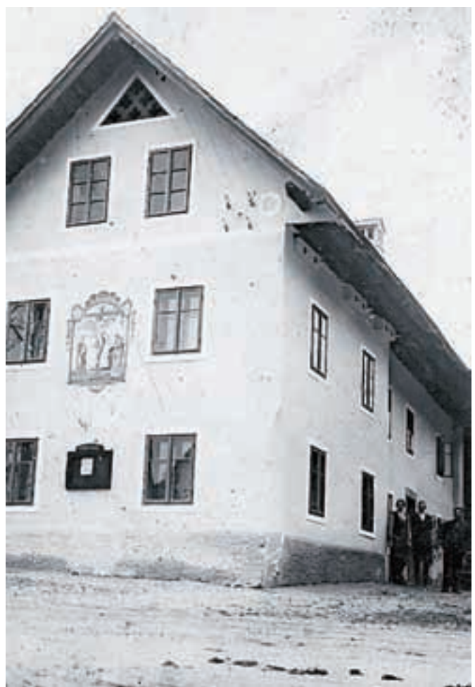
Dom v Predtrgu

Imel sem »Befehl (ukaz)«, naj se čez tri tedne zglašim v štabu v Področici. Trenutna zmaga na soški fronti in moje vojaško napredovanje me nista zaslepila. Slutil sem, da se kljub italijanskemu porazu vojna ne bo končala še tako kmalu. Informacije iz Alzacije in Lorene so bile slabe. Doživel sem preveč, da bi verjel vojaški propagandi. Toliko slovenskih družin je bilo prizadetih, toliko kameradov sem izgubil. Pokopavali smo po tri v eno rakev. V zaledju je vladala lakota. Mati so omenjali otroke, ki so v sirotišnicah umirali od grize, pa tudi od sestradanosti. Vse je šlo za vojsko. Misel, da se bom