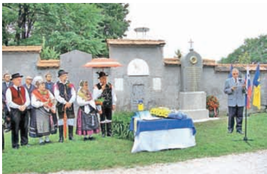
Prenovljeni spomenik Jerneja Kopitarja na ljubljanskem Navju