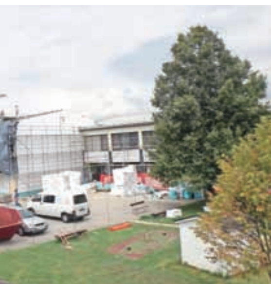
sledila še energetska sanacija.

Posebej ponosni so na dobro medsebojno sodelovanje Občine Vodice, zavodov in ljudi ter kulturnih, športnih, gasilskih in ostalih društev, ki so v zadnjem obdobju bistveno povečali svoje aktivnosti. Pomemben podatek je tudi ta, da vsa društva in zavodi delujejo dobro in pozitivno. Ob vseh omenjenih projektih Občina Vodice ostaja ena redkih pri nas, ki je nezadolžena.