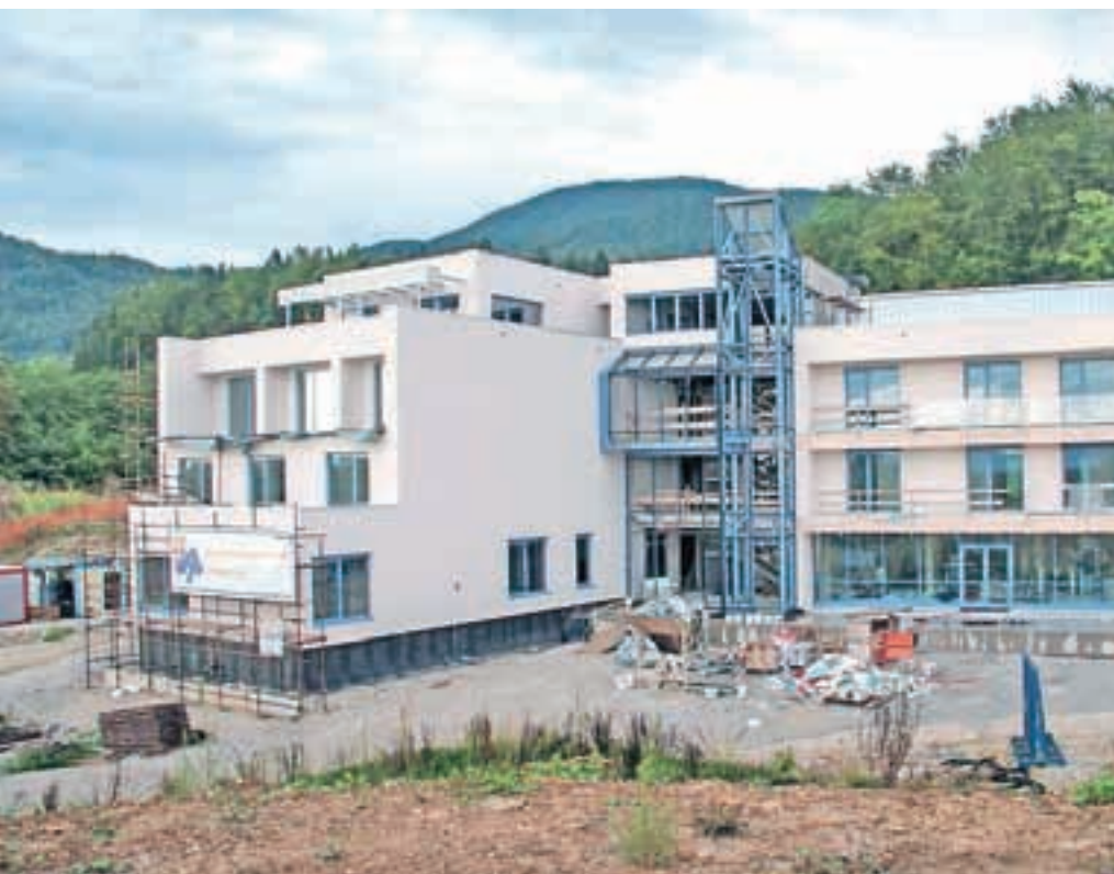
Dom starostnikov Taber

OBČINA CERKLJE NA GORENJSKEM, TRGOVA DORNA, BINKA 13, CERKLJE NA GORENJSKEM