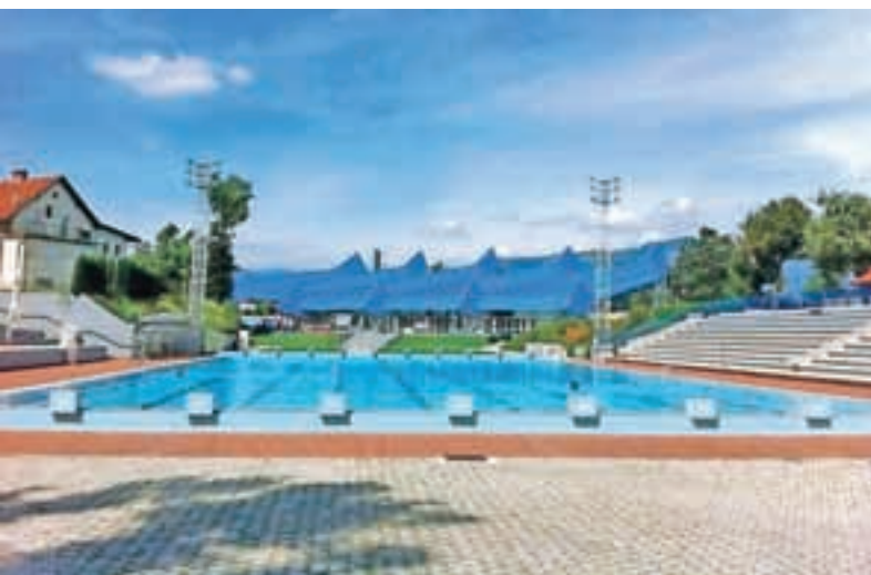
Energetsko sta prenovljena pokriti in letni bazen v Športnem centru Kranj.