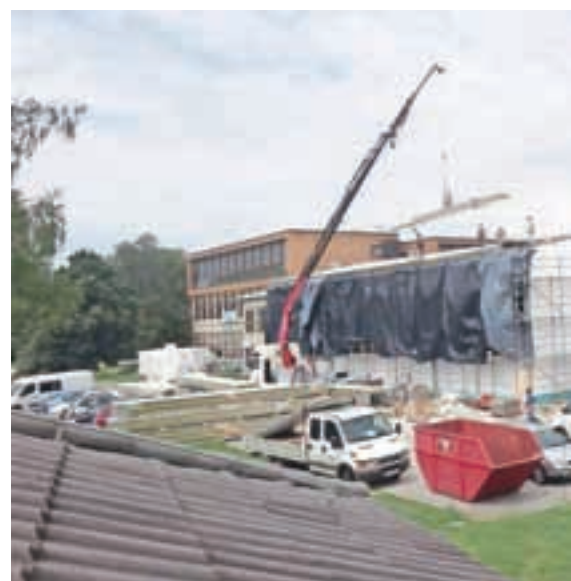
Nadgradnji in protipotresni sanaciji osnovne šole je sledila