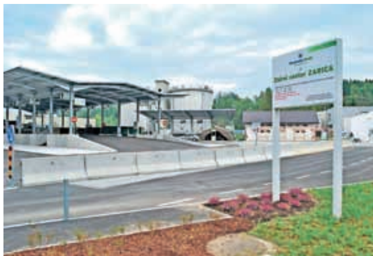
Mestna občina Kranj je zgradila zbirni center v Zarici in uredila številne ekološke otoke s podlagami in tablami z opisi.