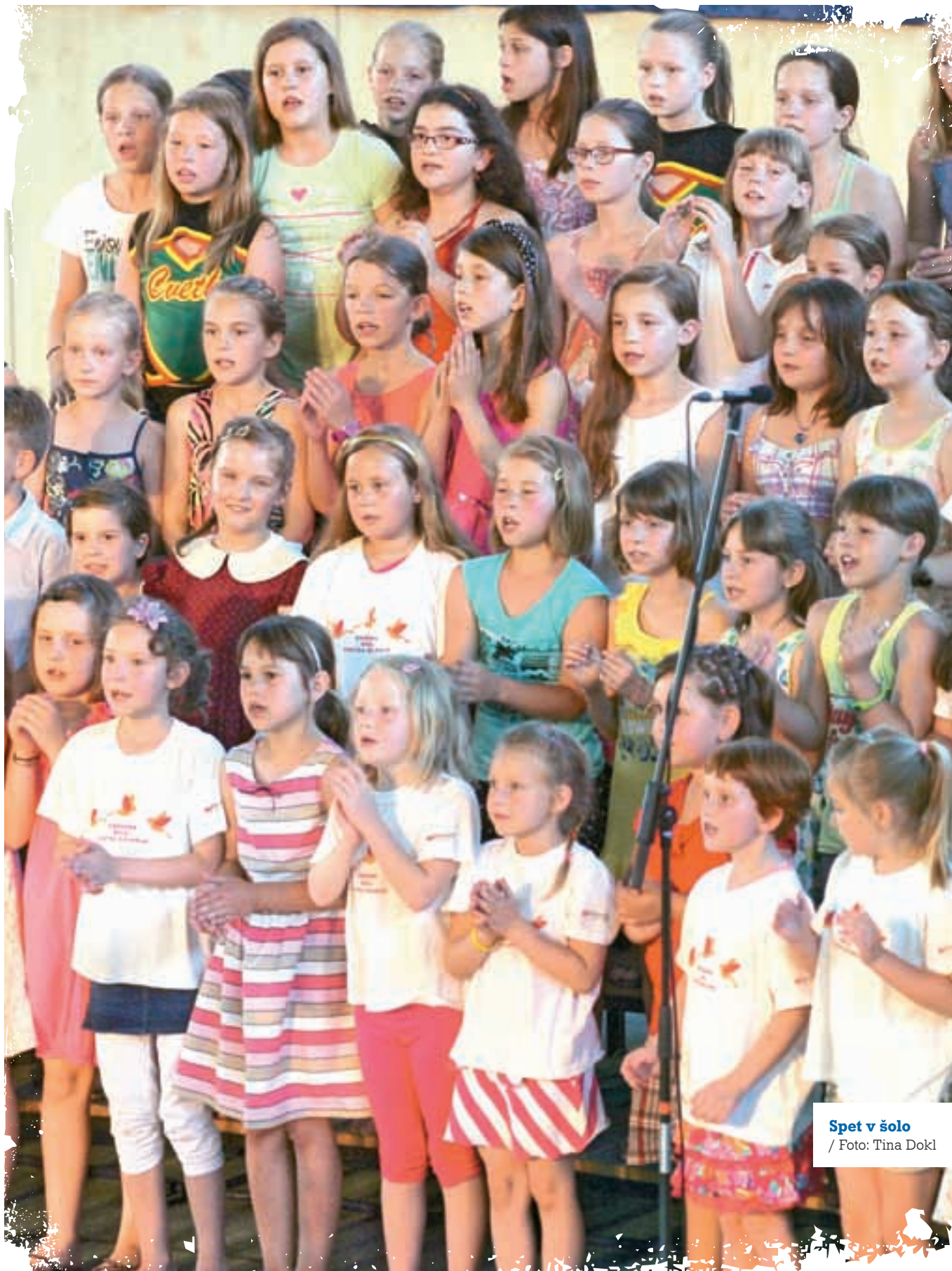
Spet v šolo