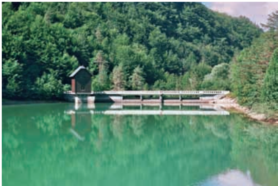
Akumulacija HE Završnica

Dne 10. marca 1914 je c. kr. okrajno glavarstvo v Radovljici izdalo rzsodbo z dovoljenjem za gradnjo električnih daljnovodov iz elektrarne na Završnici pri Žirovnici v smeri Jesenice-Hrušica, Bled-Gorje in proti Brezjam ter gradnje krajevnih omrežij. V skladu z dovoljenjem je bilo predvideno dokončanje izgradnje