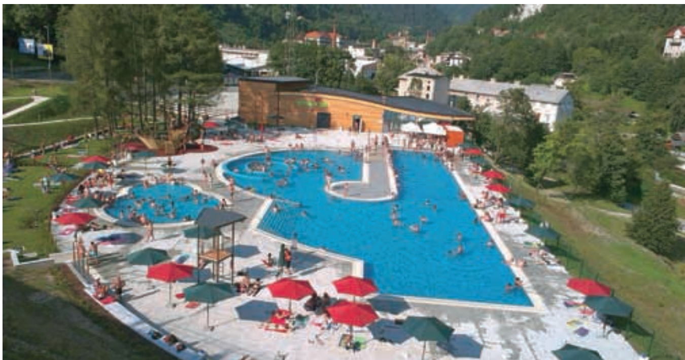
Na Gorenjski plaži pričakujemo desettisočega obiskovalca.

DEJANJA ŠTEJEJO , olajšajo življenje, povezujejo in združujejo. Hvaležen sem za družbo na poti življenja vsem in ponosen na veliko večino, s katero složno gradimo vsem generacijam in življenju prijaznejšo občino Tržič.