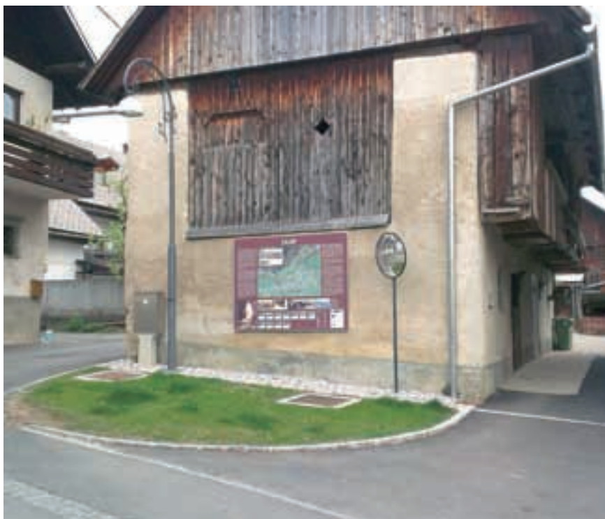
Sprejem posodobljenih prostorskih načrtov med drugim pomeni učinkovitejšo izrabo prostora, spremembe namembnosti obstoječih objektov in celovito prenovo naselij. Vaška jedra povsod vse bolj dobivajo značaj turističnih središč.