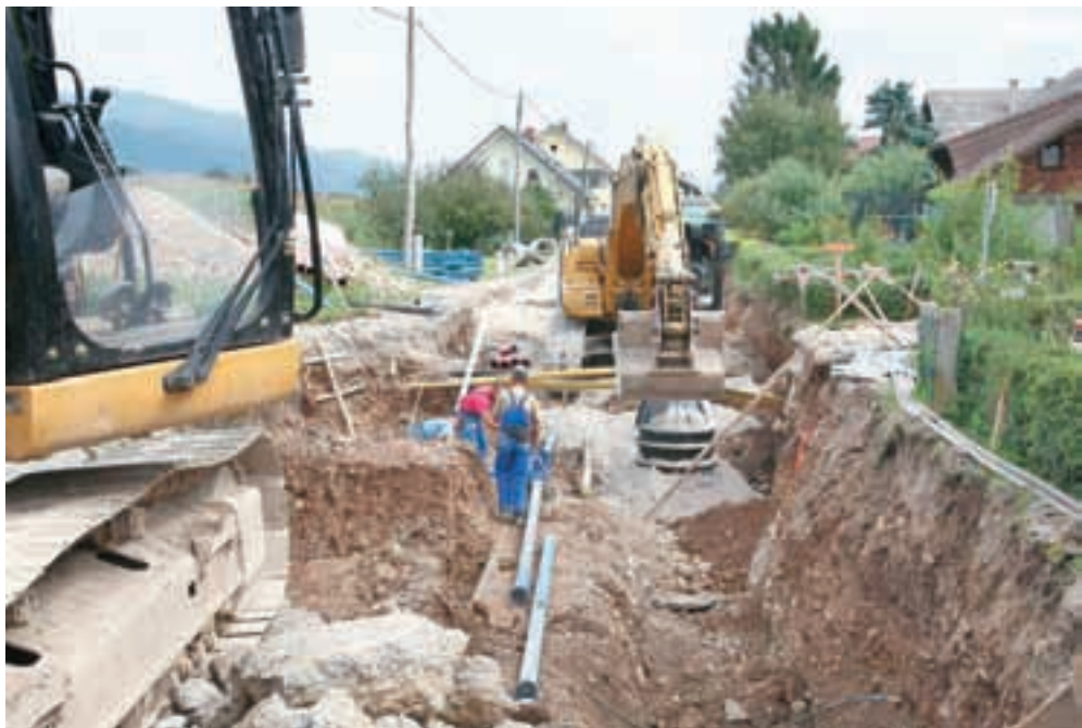
Severni del občine Šenčur je zaradi gradnje primarne in sekundarne kanalizacije ta čas eno samo gradbišče.