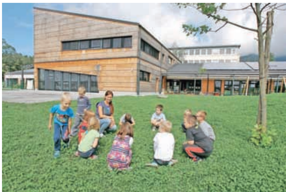
V občini Preddvor so zelo ponosni na nov vrtec Storžek.