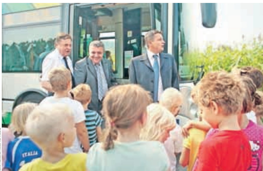
Vožnja ob odprtju nove linije avtobusov LPP