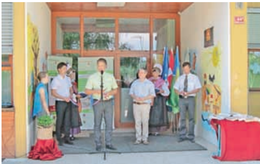
V osnovni šoli so sredi lanskega leta končali energetske sanacije.