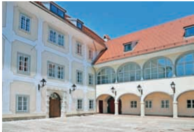
Staro mestno jedro s celovito obnovo kompleksa Gradu Khislstein