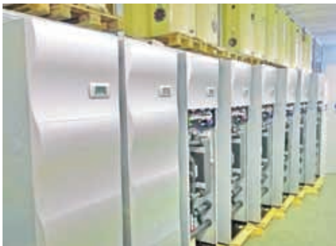
Toplotne črpalke Coolwex pripravljene za zadnjo kontrolo kakovosti pred odpremo kupcem

su sledimo naši filozofiji. Kupcem znižujemo stroške ogrevanja. Zmagovita kombinacija sistemov Coolwex je združitev natančne japonske MITSUBISHI invertrske tehnologije s slovensko proizvodnjo, oplemeniteno z evropskimi standardi. Naveza zagotavlja visok COP (4,5) ter 100-odstotno polno grelni moč tudi pri zunanjih temperaturah vse do \text{Ø}15^{\circ}\text{C} , brez elektrogrelnika. Poleg tega inteligentna Coolwex regulacija na toplotni črpalci upravlja temperaturo celotne zgradbe.«