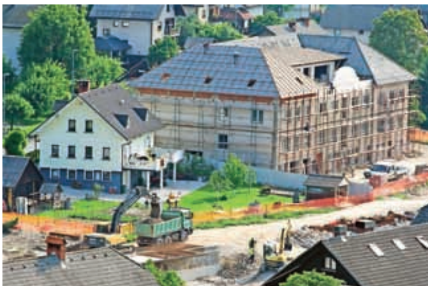
Sokolski dom dobiva novo podobo, v ospredju gradbišče gorenjevaške obvoznice.