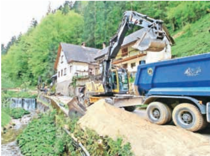
Gradnja vodovoda v Hotovlji

Pomembno je tudi čezmejno povezovanje. S ponudniki Poljanskih dobrot so se konec lanskega leta predstavili v Celovcu, letos marca na Dunaju in maja v Zgoniku pri Trstu, v juniju pa so predstavili še celotno vsebinsko turistično ponudbo na Pogačarjevem trgu v Ljubljani. Občina Gorenja vas - Poljane se je včlanila tudi v AACCC-Alpsko jadranski center, ki povezuje slovenske občine s koroškimi, na čemer so že zastavili prihodnje sodelovanje.