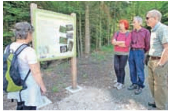
H kakovosti življenja v občinah in k turističnemu obisku pripomorejo tudi nove tematske poti.

Da bi bile kos naložbam in bi lahko zagotovile tudi lasten delež sredstev za investicije, ki je pogoj za pridobitev drugih (predvsem evropskih) virov, se občine tudi zadolžijo. Od 211 občin v Sloveniji je danes večina zadolženih, povsem brez dolga jih je le dobra desetina. Po podatkih, ki nam jih je za leti 2012 in 2013 posredoval sektor za sistem financiranja lokalnih skupnosti pri Ministrstvu za finance, skupen dolg občin znaša 840 milijonov evrov, preračunano na število prebivalcev bi to pomenilo, da je vsak občan v Sloveniji zadolžen za 410 evrov. Na Gorenjskem po znesku dolga na prebivalca najbolj izstopajo občine Komenda, Preddvor in Škofja Loka, povsem brez dolga pa so Cerklje, Jezersko, Lukovica, Šenčur, Trzin in Vodice. Zadolževanje občin sicer urejata zakon o javnih financah in zakon o financiranju občin, občine pa se lahko zadolžijo za največ osem odstotkov prihodkov zadnjega proračuna. Za zadolževanje morajo občine zaprositi za odobritev finančno ministrstvo. V občinah, kjer se odločajo za najem posojil, pri tem skušajo najti kar najcenejše možnosti. Tako so se denimo v občini Preddvor za gradnjo vrtca in kanalizacije zadolžili pri Regionalnem razvojnem skladu, ki je ponujal ugodno obrestno mero in odplačilo v petnajstih letih. Poceni kredit jim omogoča priti do dobrin, ki jih sicer nikoli ne bi imeli, pravijo v Preddvoru, saj vrednost vrtca znaša skoraj toliko kot celotni letni občinski proračun.