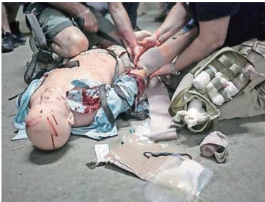
Izobraževanje je bilo zelo nazorno in intenzivno in zato še toliko bolj poučno.

»Pri tem delu lahko poleg ekstremno težkih in žalostnih stvari doživiš tudi ekstremno lepe, oba pola človeštva, in to brez vsakršnih filtrov. Mi tukaj doma smo od tega tako zelo oddaljeni, saj mediji poročajo le o spopadih, žrtvah in statistiki ... Sam tovrstnega poročanja ne maram, saj spodbuja apatijo; nisem vojni fotograf, ampak humanitarni. Ne zanimajo me toliko vojaki, kot vpliv, ki ga ima vojna na navadne ljudi, tisto, kar vojna pusti za sabo.«