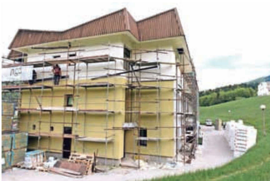
Energetska sanacija zdravstvenega doma v Gorenji vasi