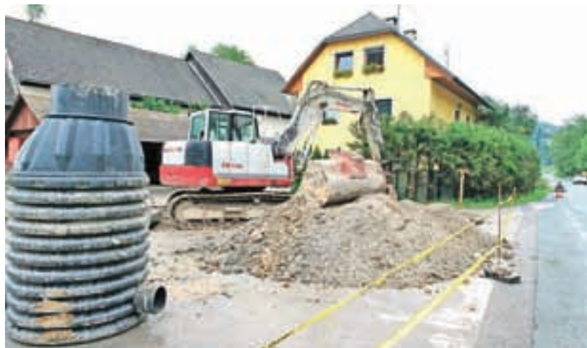
Na Gorenjskem v zadnjih letih na veliko gradijo komunalno infrastrukturo.

prebivalcev (okoli 56 tisoč). Sledijo ji občine Domžale, Kamnik, Škofja Loka in Jesenice. Najmanjša je občina Jezersko z manj kot tisoč prebivalci.