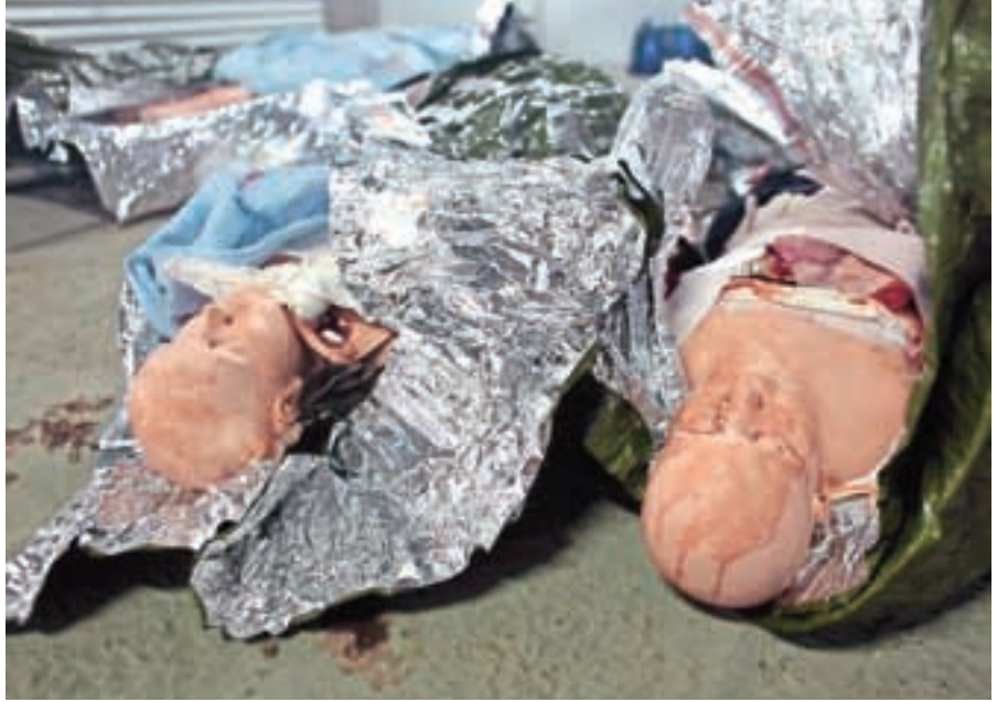
Lutke so simulirale ranjence z odtrganimi udi.