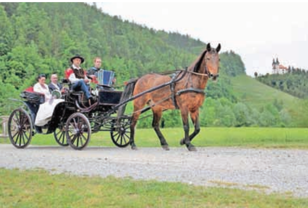
Poroka na Visokem