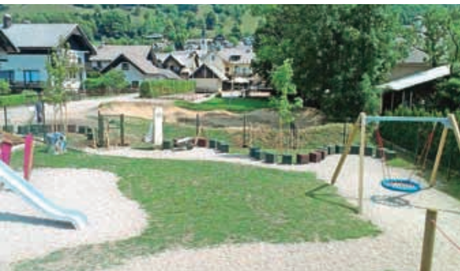
Novo otroško igrišče na Selu

Občina Žirovnica, Breznica 1, 4172 Žirovnica