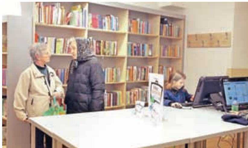
Nova knjižnica, mesto srečanj vseh generacij

Danes so na Gorenjskem naslednje občine: Bled, Bohinj, Cerklje, Domžale, Gorenja vas - Poljane, Gorje, Jesenice, Jezersko, Kamnik, Komenda, Kranj, Kranjska Gora, Lukovica, Medvode, Mengeš, Moravče, Naklo, Preddvor, Radovljica, Šenčur, Škofja Loka, Trzin, Tržič, Vodice, Železniki, Žiri in Žirovnica. Edina mestna je med njimi občina Kranj, ki je največja tudi po številu