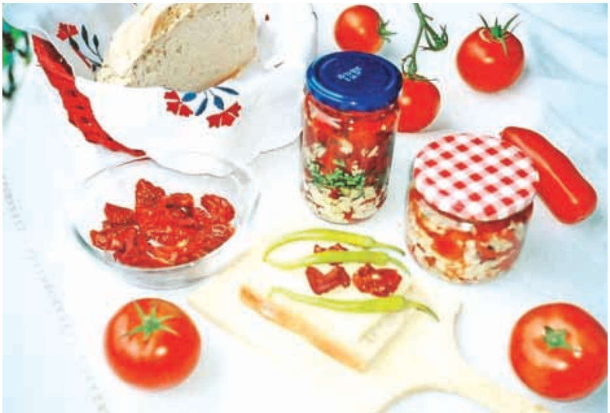
Posušeni paradižniki v olivnem olju

(3 kg). V predalčke položimo papir za peko in nanj prerezane paradižnike. V sušilniku se sušijo na srednji temperaturni stopnji približno 8 do 10 ur. Manjšo količino, 1,5 do 2 kg, kolikor jih gre na običajen pekač, lahko posušimo kar v električni pečici. Jaz imam pečico brez ventilatorja in v njej jih sušim čez noč, to je približno 12 ur, pri 75 stopinjah C, z malo priprto pečico. Nato jih sušim še na soncu (če je dovolj vroče) čez dan ali pa namesto sonca dalj časa v pečici.