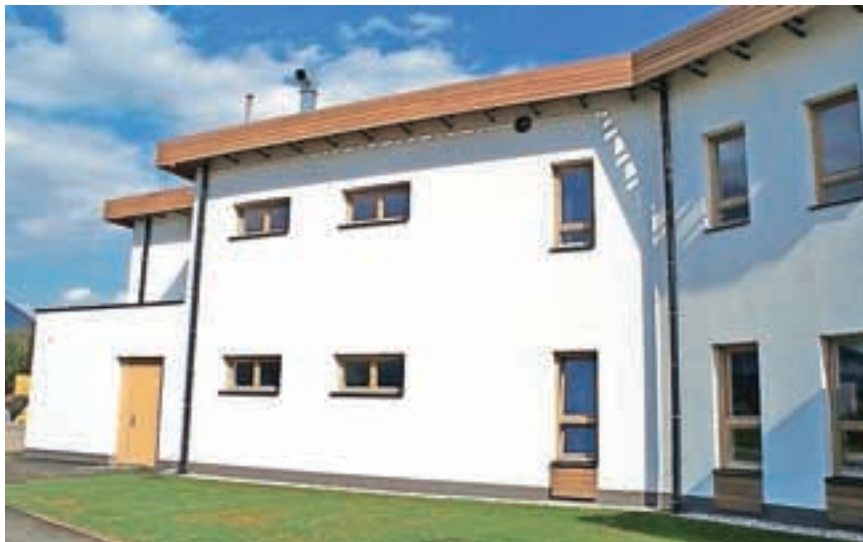
Lesena okna niso naključje.

notranje in zunanje objekte Sloluks. Cilj podjetja je kupcem ponuditi več, kot jim lahko ponudi posamezno podjetje, torej ne zgolj izdelkov, ampak celostne rešitve, ki so prilagojene specifičnim potrebam vsakega kupca.