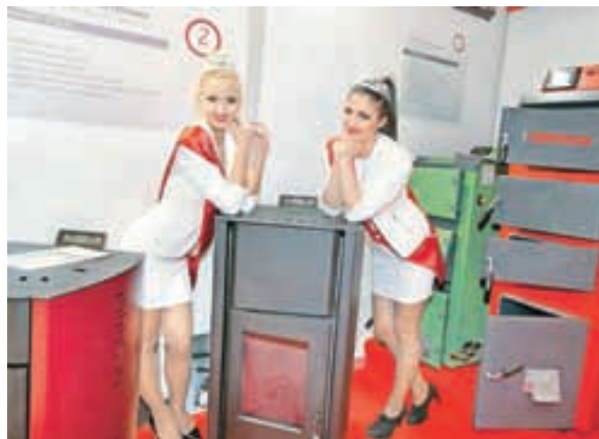
Peletni kamini in peči Coolwex za varčno in romantično centralno ogrevanje

su sledimo naši filozofiji. Kupcem znižujemo stroške ogrevanja. Zmagovita kombinacija sistemov Coolwex je združitev natančne japonske MITSUBISHI invertrske tehnologije s slovensko proizvodnjo, oplemeniteno z evropskimi standardi. Naveza zagotavlja visok COP (4,5) ter 100-odstotno polno grelni moč tudi pri zunanjih temperaturah vse do \text{Ø}15^{\circ}\text{C} , brez elektrogrelnika. Poleg tega inteligentna Coolwex regulacija na toplotni črpalci upravlja temperaturo celotne zgradbe.«