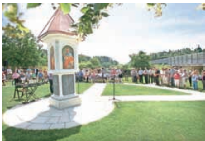
Ureditev parka na Cegelnici je plod uspešnega sodelovanja med Občino in tamkajšnjimi krajanje. Je dokaz, da se z voljo in sodelovanjem lahko doseže prav vse.