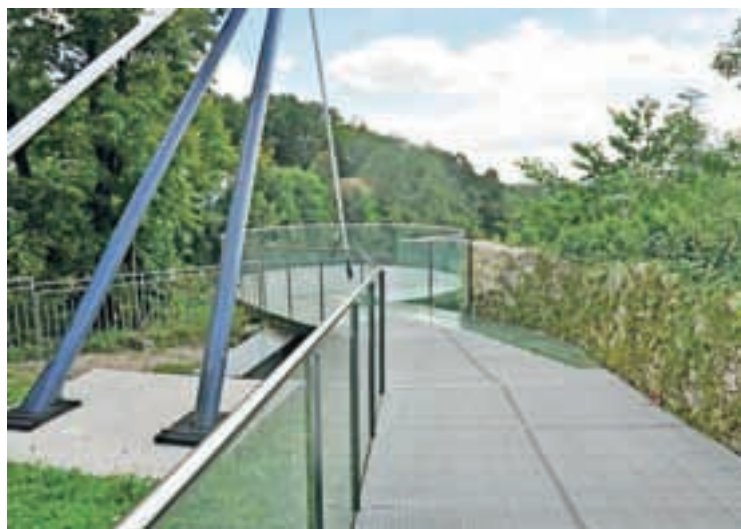
Razgledna ploščad na Pungertu