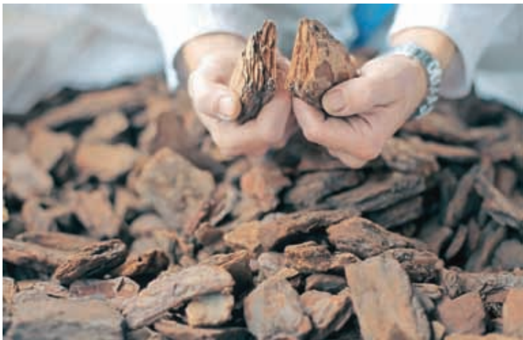
Kose lubja z značilno rdečkasto barvo ročno prebere, nato zmelje, skuha in izsuši.