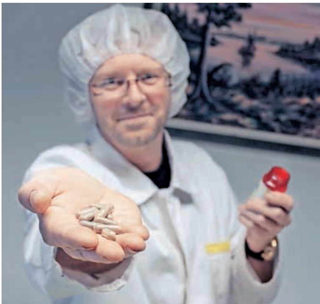
Rezultat zahtevne ekstrakcije so kapsule, ki jih za zdaj izdeluje kot edini na svetu.